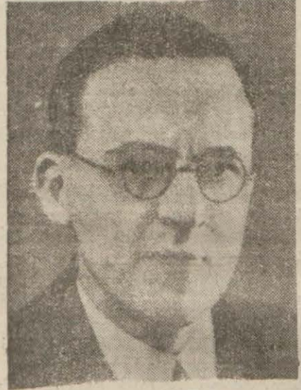
Sir Stafford Cripps

Cripps, Avam Kamarasının askeri duruma aid müzakerelere iki gün ayracağını söyledi