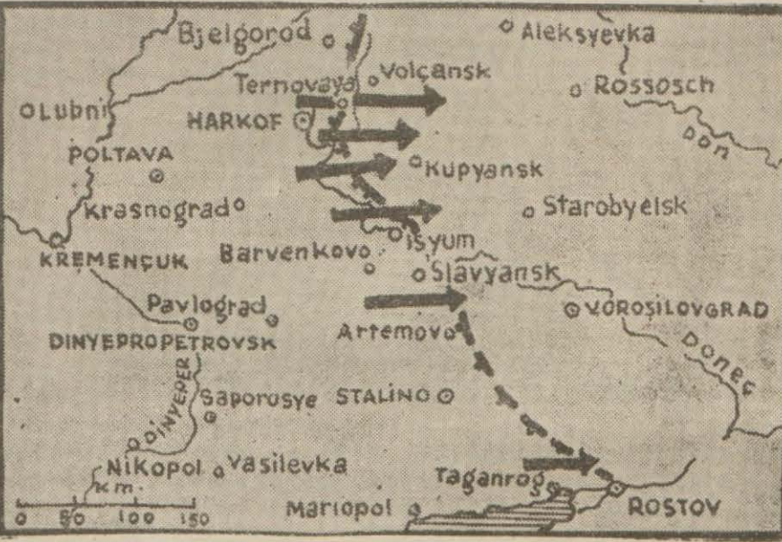
Harkov cephesini gösterir harita

Berlin 24 (A.A.) — Hususî tebliğ: Alman denizaltıları İngiliz ve