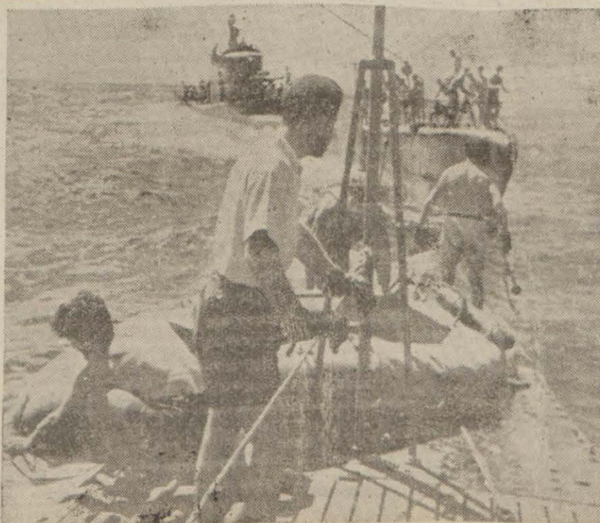
İngilizler tarafından batırılan Alman denizaltıları

İngiliz - Sovyet muahedесinin gizli hükümleri Romanya Rus nüfuz bölgesine bağlanmış